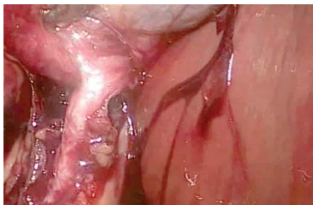
Figura 2. Conducto cístico con curvatura para ingresar a vía biliar por la derecha.

El diagnóstico preoperatorio es difícil de obtener, ya que el cuadro clínico normalmente es el mismo que el de una colecistitis con la vesícula en posición anatómica normal. 7 En caso de que haya vesículas ectópicas, como lo fue en este caso, ésta se debe identificar en el conducto y arteria cística en su totalidad y debemos estar pendientes de probables anomalías de las mismas. En la mayoría de los casos de sinistroposición, el conducto cístico entra a la vía biliar de manera común, y cualquier duda o alteración en