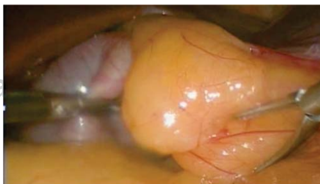
Figura 3. Vesícula por debajo del segmento III del hígado.