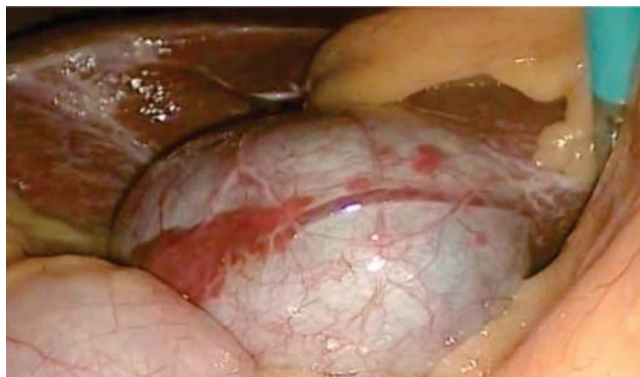
Figura 1. Vesícula a la izquierda del ligamento falciforme, con tejido hepático ectópico.